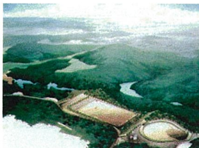
■ 上富田町スポーツセンター