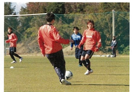
■ なでしこ JAPAN 合宿風景