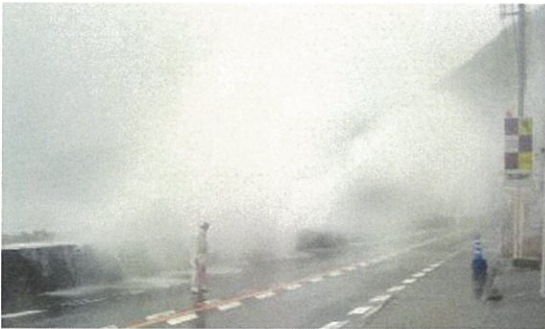
越波の影響を受ける国道42号(すさみ町)