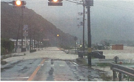
河川増水で冠水する国道42号(白浜町)